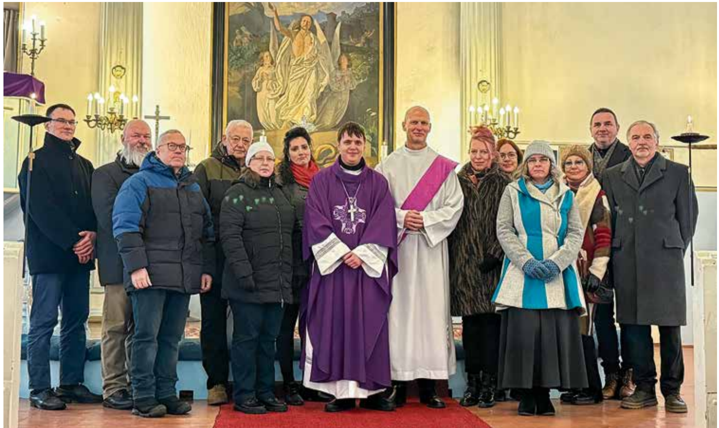
Koguduse nõukogu ja juhatuse liikmed pärast pühitust.